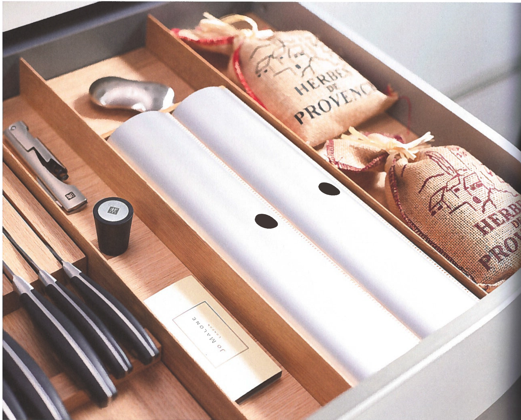
De foliehouder, één van de handige multifunctionele inserts.

De keukenlade kan wel eens een onoverzichtelijke warboel worden. Gelukkig zijn de nodige opbergssystemen beschikbaar die orde in deze wanorde scheppen. De productontwikkelaars van Kesseböhmer rustten niet op hun lauweren en met een simpel zinnetje ('Doe meer met minder') in het achterhoofd gingen ze aan de slag om een nieuw systeem te ontwikkelen. Ultieme flexibiliteit met een minimum aan componenten. Het resultaat is Fineline LiniQ. "Inzetbaar in alle op de markt beschikbare keukenlades", benadrukken zowel fabrikant Kesseböhmer als distributeur Van Opstal.