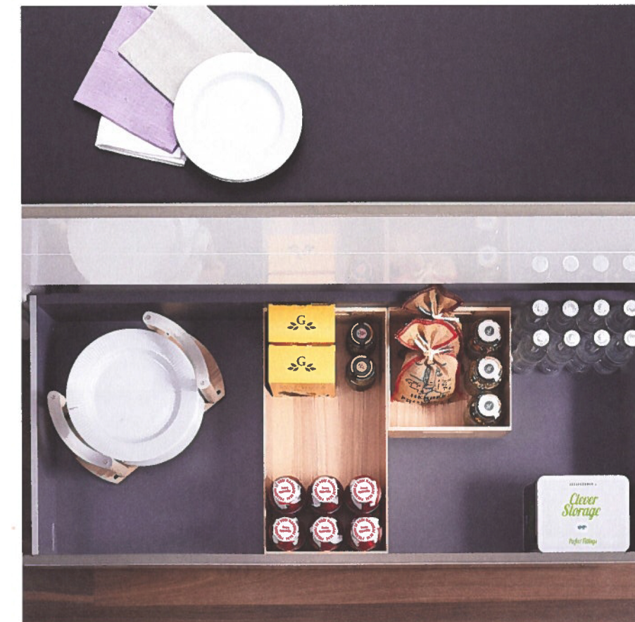
Ook nieuwe oplossingen voor de hogere lades waar potten en pannen in terecht kunnen.

Ook voor de hogere lades, daar waar traditioneel de potten en pannen opgeborgen worden, creëerden de productontwikkelaars van Kesseböhmer nieuwe elementen. "Een vierkant en een rechthoekig bakje met greepgaten, eveneens beschikbaar in de hierboven genoemde drie houten afwerkingen, zorgen meteen voor orde in deze hogere lades", aldus Van Opstal. "Twee vierkante bakjes naast elkaar zijn trouwens even lang als één rechthoekige. Zo kan de gebruiker van de lades naar eigen wens en inschatting de juiste keuze maken. Een metalen verdeelstuk met greepgaten kan, indien gewenst, ingezet worden in deze bakjes. Ook handig in deze hogere lades is een aanpasbaar houten borderek zodat grote of kleine borden hier veilig gestapeld kunnen worden."